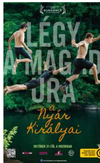
A nyár királyai

Joe és Patrick gyerekkori jóbarátok, akik a hétköznapi tinik nyomorúságos életét élik öröklődve a sulis és a család között.