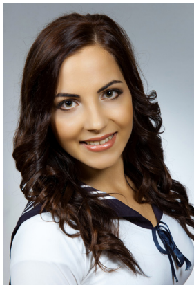
Gura Kata 12.A Iskolámról iskolámért - díj