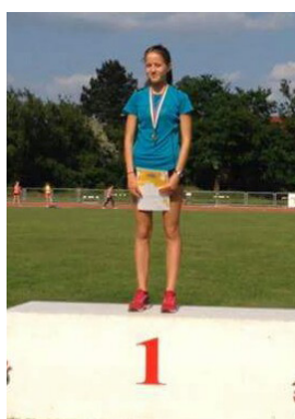
1500m 1. hely Pavuk Tíra

A 2015. május 31-én és június 1-jén került megrendezésre Székesfehérvárott az Országos Atlétika Diákolimpia, ahol a 2014/2015-ös tanév eddigi sikereit folytatva, nagyon szép eredményeket értek el gimnáziumunk tanulói.