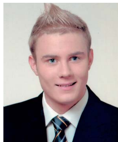
Rente Martin 13. D Az év története