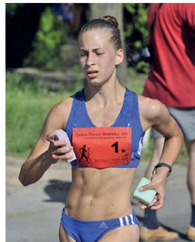
Marton Mercedes II. B

Országos Dzsúdó Diákolimpia U15 III. hely