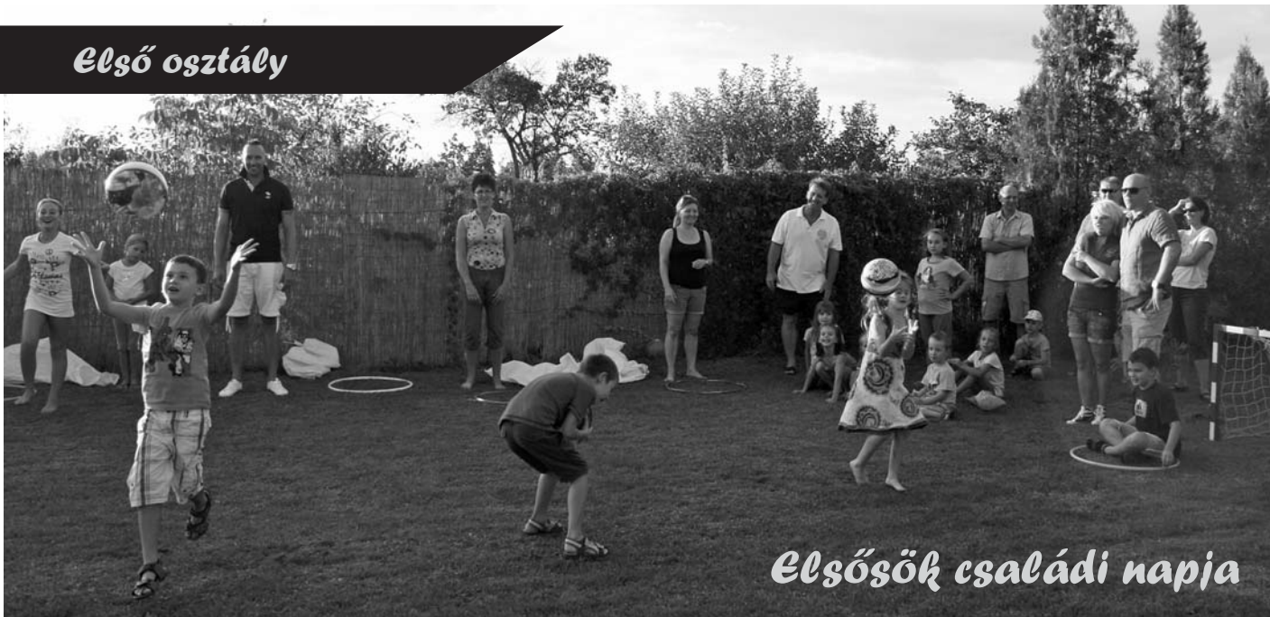
Elsősök családi napja